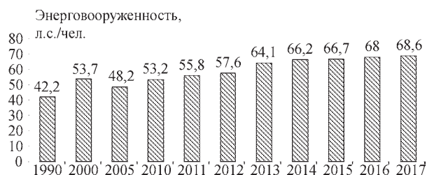
Рис. 1. Энерговооруженность сельскохозяйственного труда в Республике Беларусь, л.с./чел.

Произошли значительные изменения и в социальной сфере. Создана разветвленная сеть агрогородков, обеспечивающая со-