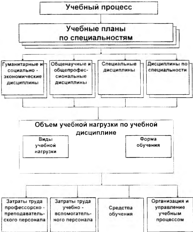
Рис. 1.2. Структурно-логический комплекс объектов управления учебным процессом

Наличие объективной информации о величине затрат по каждой учебной дисциплине позволяет определять реальную себестоимость подготовки специалиста в той или иной области знаний. На этой основе можно формировать цену на обучение по специальностям, исходя из планируемых затрат и в соответствии со сложившимся спросом на определенную профессию.