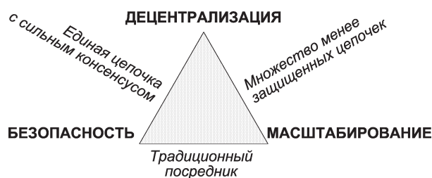
Рис. 1. «Трилемма блокчейна»

В данном случае для понимания экономических последствий трилеммы на практике не обязательно описывать техниче-