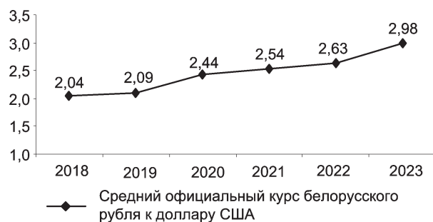
Рис. 2. Изменение среднего официального курса белорусского рубля к долл. США, устанавливаемого Национальным банком Республики Беларусь, 2018–2023 гг. (10 мес.)