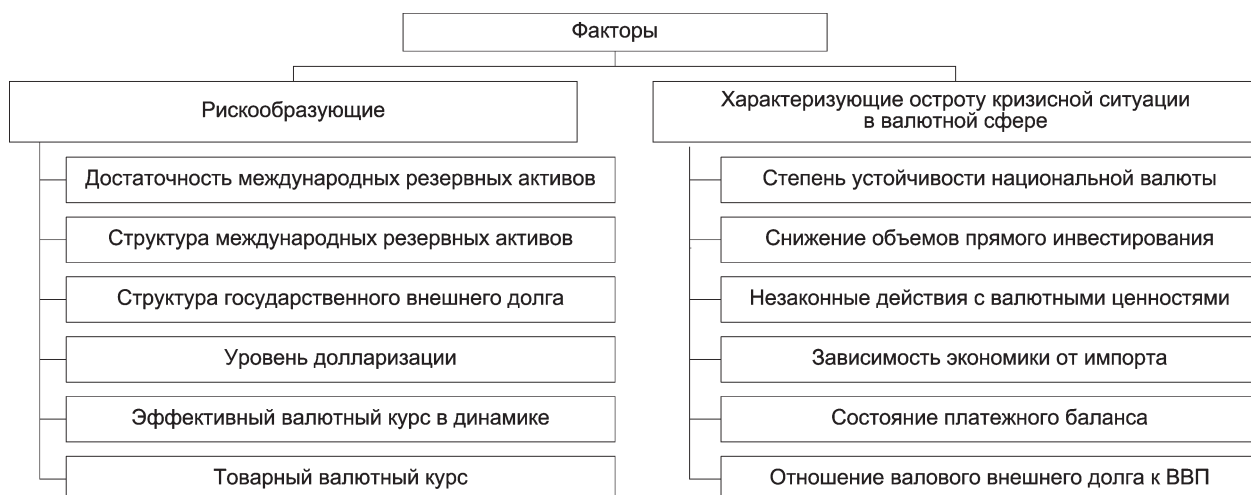
Рис. 1. Факторы, оказывающие влияние на состояние валютной безопасности